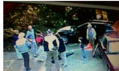
jetzt stehen auch die Kinder rum