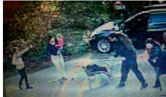
letzter Hieb, den filmt das Mädchen auch.