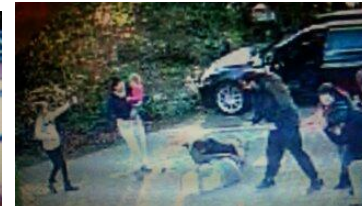
beim 27. Hieb reisst, zerrt und spuckt die Sippenfrau immer noch.