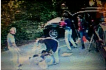
C.B. spricht und hilft E.B