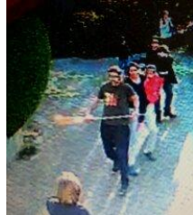
Matieu G. greift nochmals an