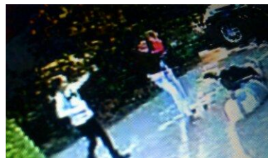
alles drauf bis zum letzten Angriff