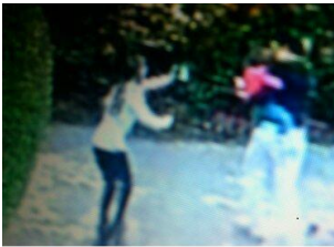
alles auf Film festgehalten,