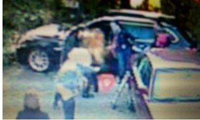
2. Spray-Einsatz auf Mathieu Gaijean