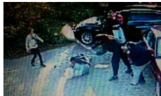
beim 22. Hieb tritt das filmende Mädchen der Sippe näher.