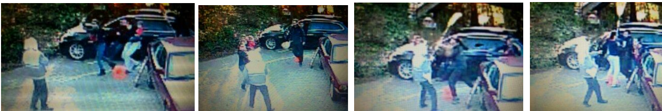
Frau mit Stange macht bange Frau mit Faust auch