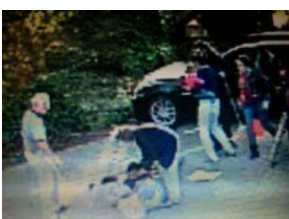
C.B. will helfen, da wird sie von diesem dahergelaufenen Helfer gepackt, festgehalten