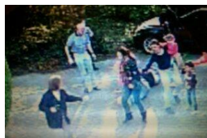
C.B. reisst sich los und wird sofort wieder von der Sippenfrau verfolgt